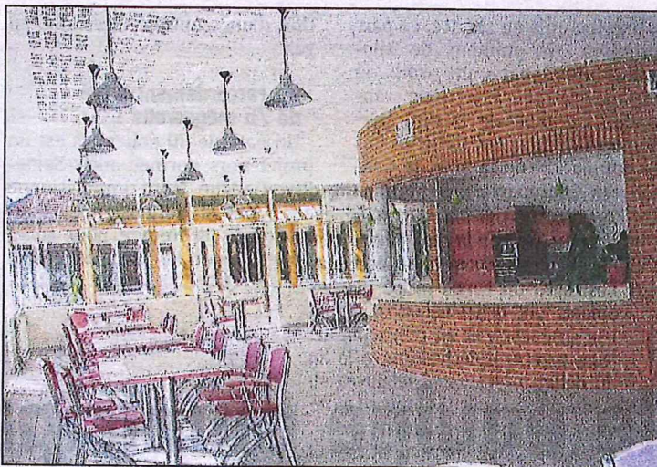
Une décoration choisie pour l'espace repas éclairé par de larges baies vitrées.